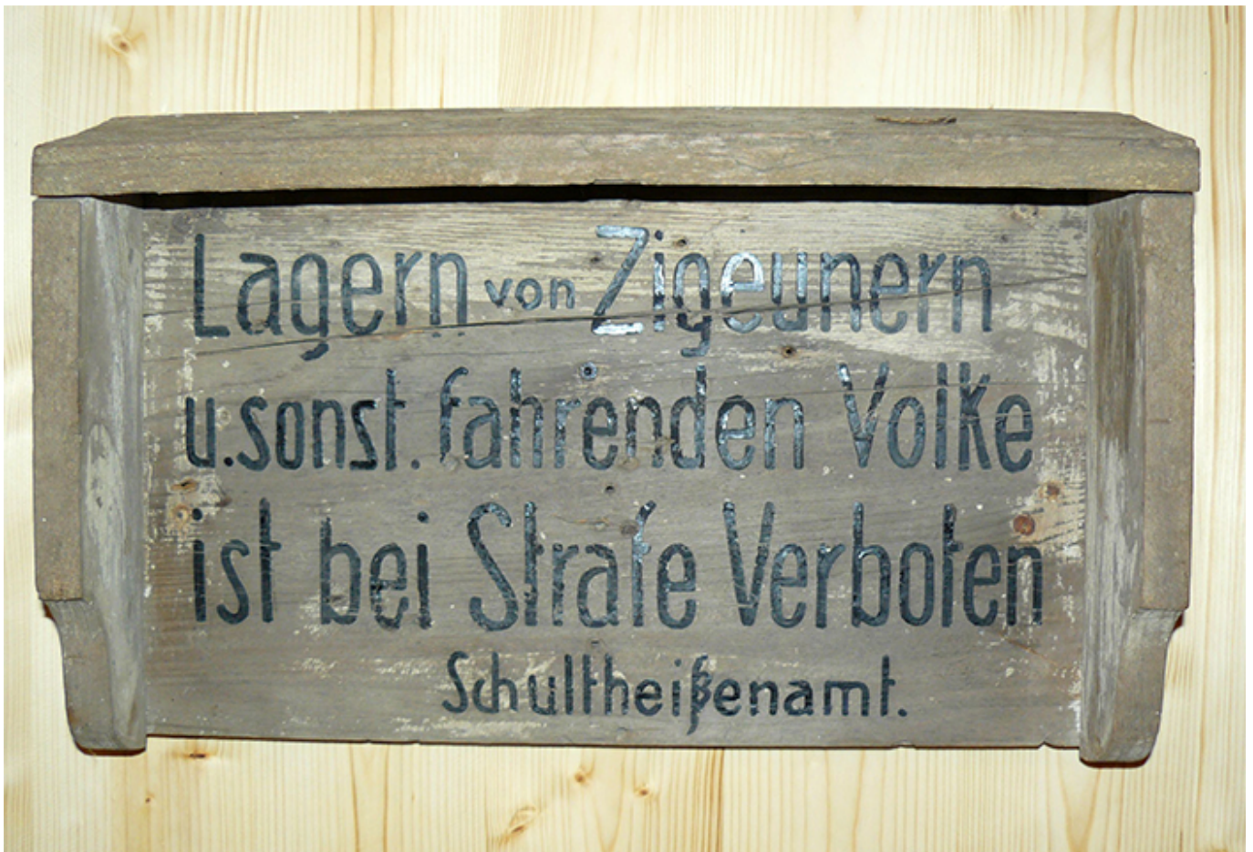
Verbotsschild, vermutlich 1920er-Jahre

Erstmals rückt eine Ausstellung in Frankfurt am Main die Verfolgung und Ausgrenzung von sogenannten „Asozialen“ und Berufsverbrechern“ während der Zeit des Nationalsozialismus in den Blick. Bis heute kämpfen die mit dem schwarzen und grünen Winkel im Konzentrationslager gekennzeichneten Männer und Frauen um ihre Anerkennung als Opfer nationalsozialistischen Unrechts.